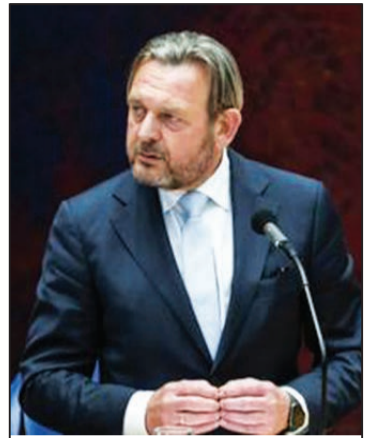
Ombudsman Nashonal Reinier van Zutphen.

Un bosero di fundashon finansiamentu di estudio di Kòrsou a deklará den un transmishon, ku solamente e asina yamá studiantenan ‘free movers’ ku ta biaha riba nan mes, ta konfrontá problema i esaki no ta e kaso pa esnan ku a skohe pa bai bou di guia di e fundashon.